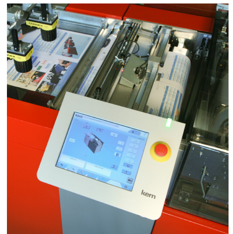
Plate-forme logicielle Sphera

Le système est conçu pour être connecté aux solutions logicielles Kern mailFactory®.