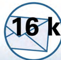
Kern 1600 fast