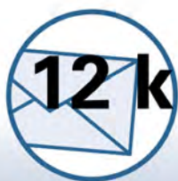
Kern 1600 flex

Neue Funktionen, wie die Geschwindigkeitsanpassung und die präventive Fehlerbehandlung, sind ein grosser Mehrwert für unsere Kunden, um die Produktionseffizienz zu steigern.